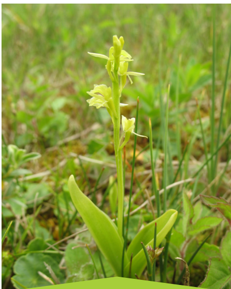
Liparis de Loesel

Ce travail a été mené en lien étroit avec les élus référents et chargés de missions des cinq territoires et a été accompagné par un ensemble de référents institutionnels et scientifiques.