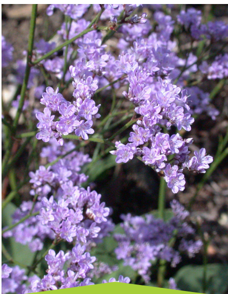
Stachys humble

Ce travail a été mené en lien étroit avec les élus référents et chargés de missions des cinq territoires et a été accompagné par un ensemble de référents institutionnels et scientifiques.