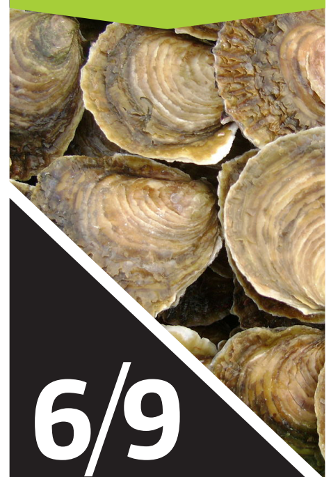
Huîtres plates ( Ostrea edulis )